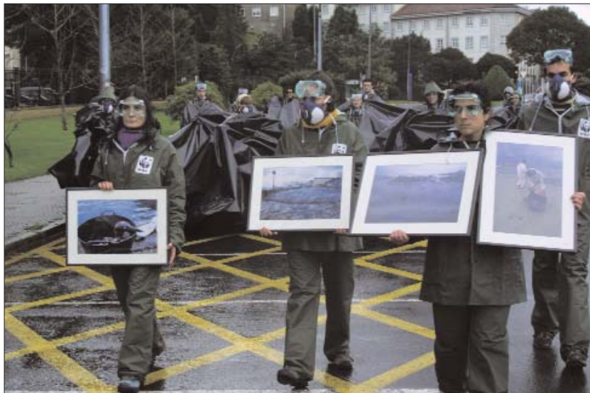
Voluntarios de WWF/Adena se manifiestan contra la catástrofe del Prestige.