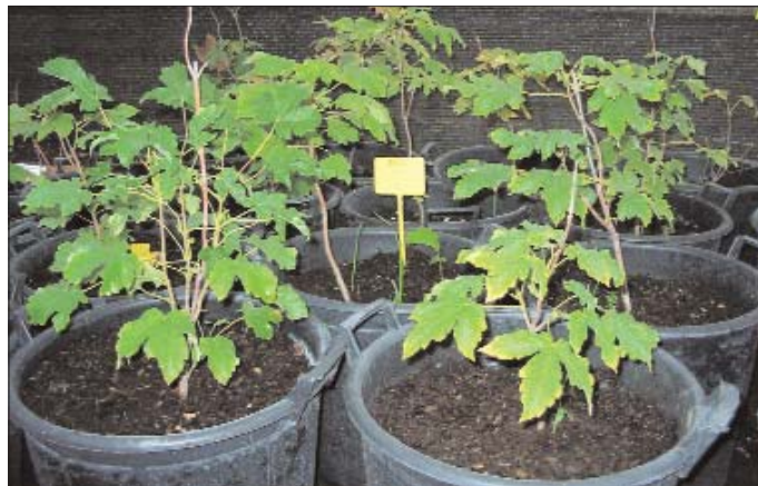
Instalaciones del Vivero Participativo de Villa Román (izquierda) y detalle de algunas plantas en la zona de sombra (derecha).