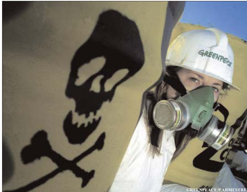
Una activista de Greenpeace, en una acción en la incineradora de Constantí, (Tarragona).

En 1994, con la guerra de Ruanda y la 'campaña del 0,7', el compromiso social vivió un impulso sin prece-