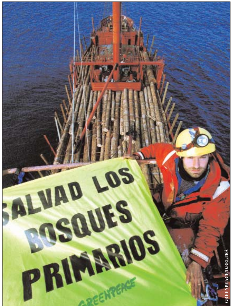
Activista de Greenpeace, en el mástil del Metelmi, un barco cargado de madera ilegal.

Entre lo negativo, resaltan que estas organizaciones no cuentan con medios suficientes (43,42%) y que realizan la labor de los gobiernos (24,30%). Además, los jóvenes señalan que no se fían del destino del dinero que recaudan (15,53%). El citado estudio también apunta que la valoración positiva sobre las ONG es ligeramente superior entre quienes alguna vez han participado con alguna de ellas y conocen su trabajo desde dentro.